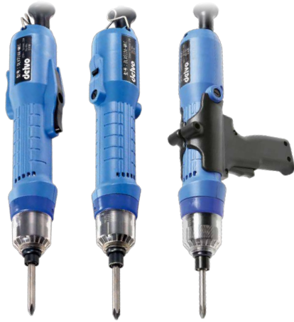
DLV7104系列 DLV8104/8204系列 DLV8154